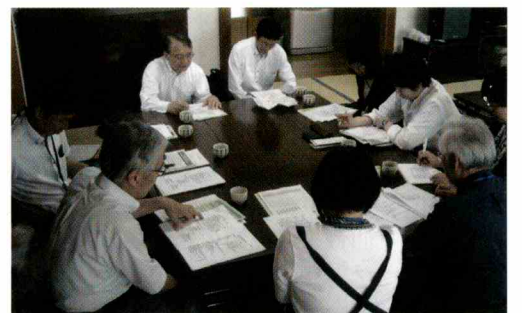
コミュニティバス運営協議会での聞き取り

この試験運行で収支率が3割を超えれば、本格導入に向けた最終段階の実証運行につながります。利用促進の取り組みが求められています。