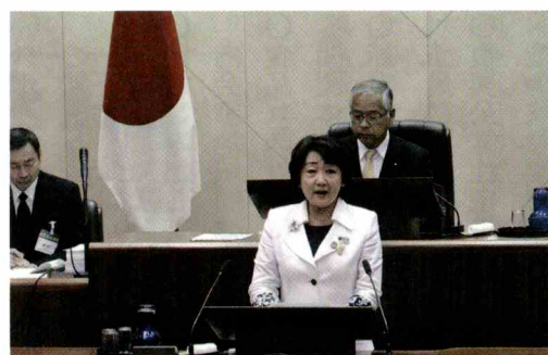
本会議で議案提案を行う郡市長

令和元年仙台市議会第3回定例会は、9月19日から10月23日まで開かれ、平成30年度