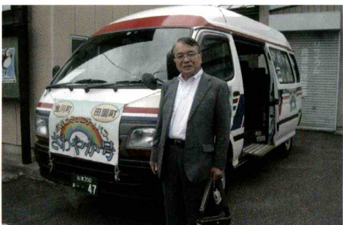
会津若松市の地域交通「さわやか号」

行されました。しかし、運行経費の収支目標が2割から3割に引き上げられたこともあり、地域の企業、商店、病院等の協賛金をいただくこととなりました。結果的には1日の乗車は30人弱で目標の40人には届きませんでした。第3弾は、ルート等は大きくは変わりませんが、初の冬場の試験運行でもあり、月・水・金の1日3便の運行計画となりました。