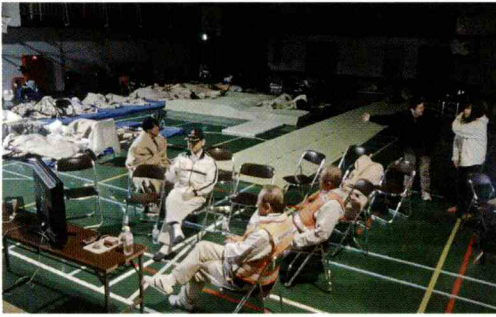
避難所となった燕沢小体育館

燕沢小学校では、12日の午後から避難所が開設されました。深夜に近づき、被害想定が増える中、避難される方が増え、最終的には17組、46人の方が避難してきました。2名の運営担当の市職員に加え、各町内会長とつじ議員も運営にかかりました。