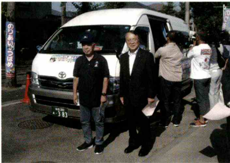
高砂タクシーに変更した「のりあい・つばめ」

4月から9月までの2回目の試験運行は、1日8便、水・金の週3日で、ルートも仙台オーブン病院やJR東仙台駅までの延長も図られました。運賃200円は1回目と一緒に、回数券や定期券も発