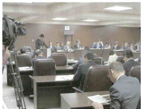
再発防止策としては、①学校内の情報共有や教職員間の連携と役割分担によるいじめ問題への適切な対応体制の整備

②いじめの認識に際しては初期対応を適切に行う体制、③発達に特性のある児童生徒への理解と支援、④教職員の多忙化の解消、⑤地域が子どもを見守り育てる仕組みづくり、⑥市のいじめ防止策に対しての総括的な役割、などを提言しました。