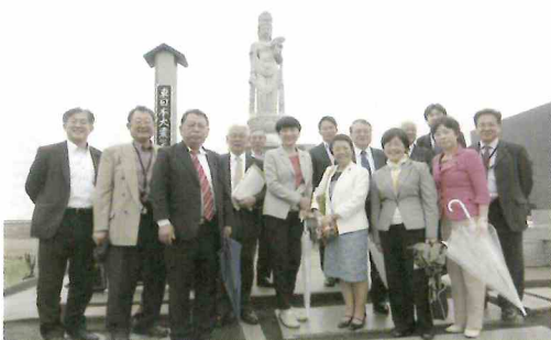
荒浜地区慰霊塔前で

会が仙台市で開催されました。テーマは「大災害への対応」とし、1日目は地下鉄荒井駅構内の「震災メモリアル施設」、震災遺構として整備した旧荒浜小学校、津波避難タワー等の被災地及び復興事業の視察を行いました。