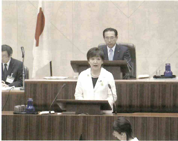
第2回定例会で議案提案を行う郡市長

また、市立病院事業使用料及び手数料条例の一部を改正する条例も上げられました。これは、保健医療機関に関する規則の改正に伴い、400