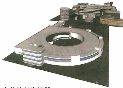
東北放射光施設の完成予想図