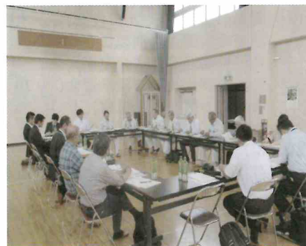
30年度第1回燕沢交通検討会 (6/18)

燕沢の地域交通はこれらの有効活用の第一歩でもあり、その事業展開に大きな期待が寄せられています。