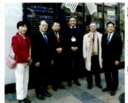
八戸ブックセンター前で

戸ブックセンター」、郷土芸術・芸能等を観光交流の核として取り組む施設「ハッチ」及び新美術館整備事業を視察しました。