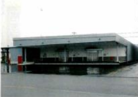
中央卸売市場の新冷蔵庫棟

その他の案件では、東部復興道路(県道塩釜亘理線)のかさ上げ工事に関する工事請負契約の変更や、西山児童館