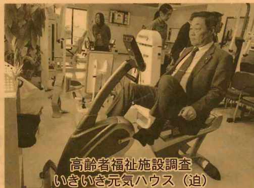
高齢者福祉施設調査 いきいき元気ハウス（迫）