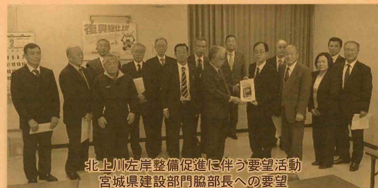
北上川左岸整備促進に伴う要望活動 宮城県建設部門協部長への要望

ボート競技参加国（ポーランド）の事前合宿誘致により、市民とオリンピック選手の交流と、受入支援を図るもの。 総額14,893千円（内訳：支援事業11,801千円、交流事業1,092千円、その他2,000千円）