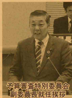
予算審査特別委員会 副委員長就任挨拶