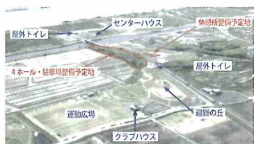
公式大会開けるパークゴルフ場拡張計画進む