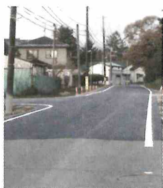
沿道住民の安心・安全を確保する広幡2号線（実沢・小角）改修工事進む