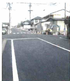
長年の地域要望に応え、山の寺2丁目道路改良と側溝整備実現