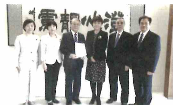
社民党会派で新型コロナウイルス感染症対応に関する申し入れ