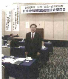
仙台・福島・山形3市議会広域観光連携協議会研究会（山形市）