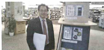
仙台市・富谷市広域行政協議会他都市視察で神戸市、明石市（あかし市民図書館）へ