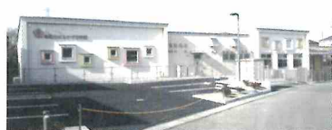
地元の声に応え前向陽台保育所跡地に『はるかぜ保育園』完成