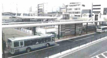
社民党市議団が求めたJR仙台駅西口バスプール拡張で一部供用開始