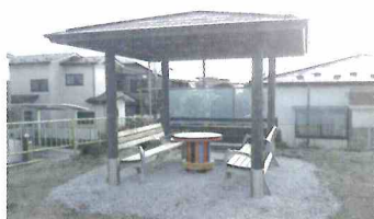
住民が憩う東屋が向陽台5丁目公園に誕生