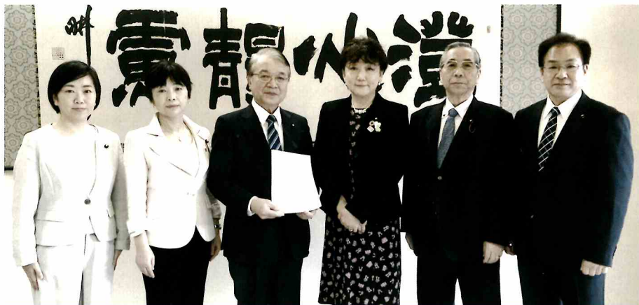
3月12日、社民党仙台市議団として、仙台市長に申し入れをいたしました。