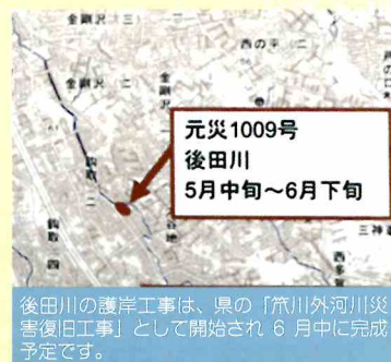
後田川の護岸工事は、県の「荒川外河川災害復旧工事」として開始され6月中に完成予定です。