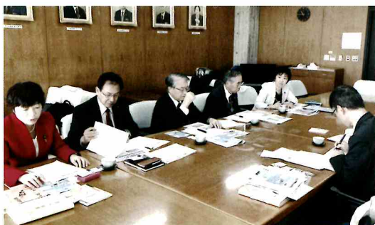
社民党仙台市議団で世田谷区を行政視察。切れ目のない子育て支援の説明を受ける。

度訪問介護などの制度を使って一人暮らしをすることを本市で実現するために質問をいたしました。実際の支援にあたる介護事業者の人材確保や支援スキルの向上も必要であると考え、今後の施策の進め方を質しました。地域における障害に対する理解の浸透が不可欠であり、理解促進に努めるとともに、適切な相談支援の基盤の適正な支給決定に努めるとの答弁でした。また人材の確保につながるよう、報酬水準の引き上げについて引き続き国へ要望していくということです。 2019.12