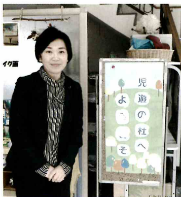
不登校児童生徒のための「児童遊の杜」。「杜のひろば」も市内7箇所から、8箇所に増えます。

不登校児童生徒の支援のあり方について、文科省通知の周知方法を尋ねました。フリースクール、民間団体等、保護者による活動について情報収集を求め、「職員を派遣してお話をうかがうなど連携を深めてまいります」との答弁がありました。不登校選任教諭の導入については、新年度は課題整理をはじめとした検討を進めるとの答弁がありました。 2020.2