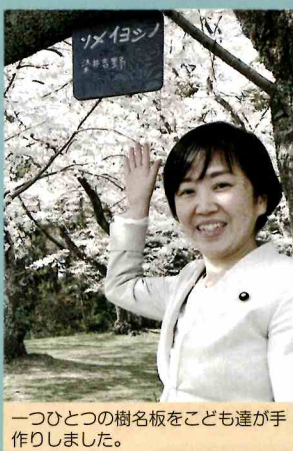
一つひとつの樹名板を子ども達が手作りしました。

西多賀まちづくり推進委員会の皆様が、三神峯公園の桜の樹名板を子ども達と一緒に制作し、取り付ける活動をされています。公園の桜を通じて地域を学び、交流を促進する取組です。制作の様子や設置後の視察をいたしました。本年は各地でお花見や桜まつりが実施できず残念でしたが、心身の健康維持やリフレッシュに「密」を避けてのお散歩をおすすめします。