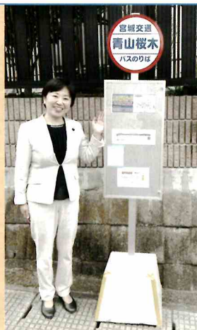
新しいバス停の設置やごみステーションの移動など住民の皆様のご協力をいただき、4月1日に第1便が走り出しました。

八木山動物公園駅～宮交自動車学校～長町駅東口を結ぶルートで、1日4往復(8本)、平日のみの運行です。住民の皆様のご協力で、新しいバス停が「桜木町・青山桜木・弥生青山北・弥生青山・弥生青山東」の5箇所新設されました。