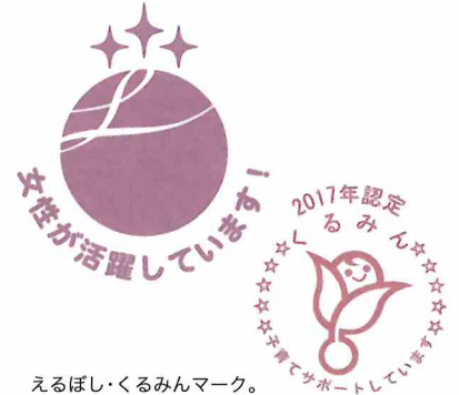
えるぼし・くるみんマーク。

また、多様な性のあり方を理由とした社会的偏見や差別をなくすための取組みとして、昨年度行われた市職員の研修について質し、「正しい知識を得ることを目的に実施したもので、市民に接する業務、窓口を持つ職場のほか、市民利用施設の指定管理者等から、200名以上が参加した。さらに多様な性のあり方についての企業への啓発のあり方等を検討していきたい」と答えがありました。