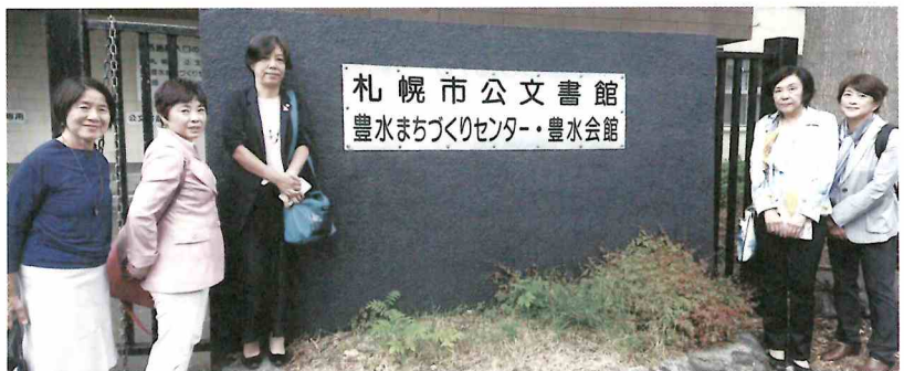
学校跡施設を利用した札幌市公文書館。

札幌市保健所では市民協働でつくられた札幌市安全・安心な食のまち推進条例に基づき、市民、事業者とも主体的に食の安全を担い、食中毒等が発生したことを想定した健康危機管理シミュレーション訓練等の説明を受けました。食に関する条例の先進事例を仙台市の施策にも活かしたいと思えます。