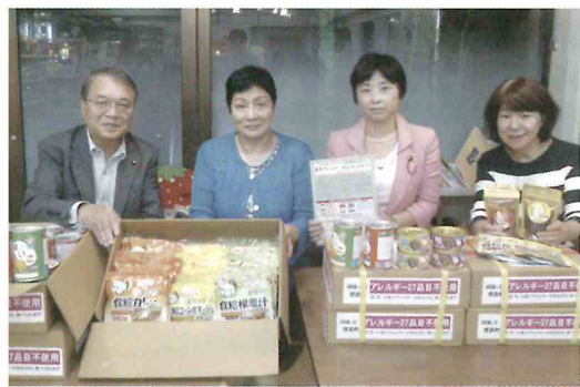
北海道地震支援～アレルギー対応食品を厚真町に送付する市民団体の皆様と。