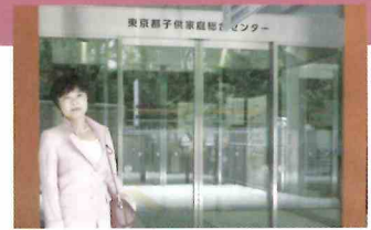
2013年にリニューアルされた児童相談センター。

東京都の中央児童相談所として位置付けている児童相談センターには、親子が宿泊できる部屋、気持ちを静める部屋等も整備されています。また「治療指導室」を置いており、一緒に食事作りができる調理室、音楽室、工作室があり、専門の職員が指導にあたっています。