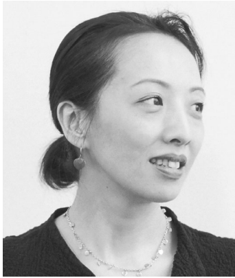
ヤン・ヨンヒ 梁 英姫

上智大学卒業後、コロンビア大学大学院修士課程などを経て大阪大学大学院国際公共政策研究科修士課程修了。テレビ局、財団に勤務後、東京大学客員助教授などを経て、2004年より中央大学総合政策学部教授。著書に『地雷なき地球へ一歩を現実にした人びと』『行動する市民が世界を変えた』ほか多数。