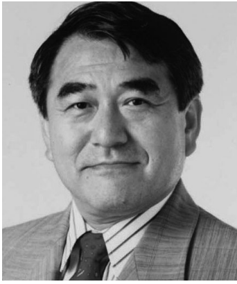
てらしま じつろう 寺島 実郎