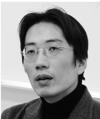
ゆあさ まこと 湯浅 誠

1975年よりパントマイムを始める。1985年「お笑いスター誕生」で優勝。1988年コント集団「ザ・ニュースペーパー」の結成に参加。1998年に独立。以後、時事風刺のトークやコントで定期的なソロライブを行いながら、寄席にも進出。2000年から09年は立川志の輔さんの「志の輔らくご」に毎月ゲスト出演。2005年、「立川談志 日本の笑芸百選」に選ばれる。