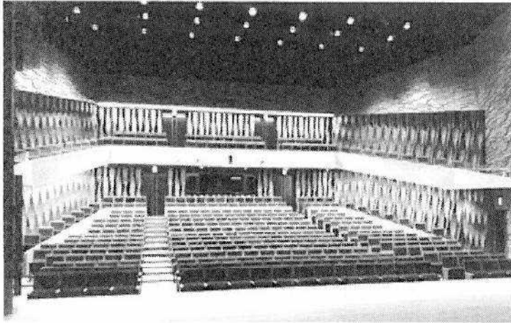
文化ホール舞台から客席を望む